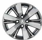
16" Diamanté Hyde Dilium grey

JANTE ALIAJ 17" Diamanté Eridan Anthra grey