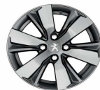
16" Diamanté Hyde Anthra