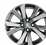
17" Diamanté Eridan Anthra grey