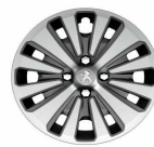
16" Strontium finisher- pt. BVMP