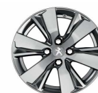
16" Diamanté Hyde Dilium grey