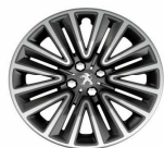
16" Two tone Silice finisher

JANTE ALIAJ 16" Diamanté Hyde Dilium grey