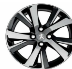
17" Diamanté Eridan Noir Brilian