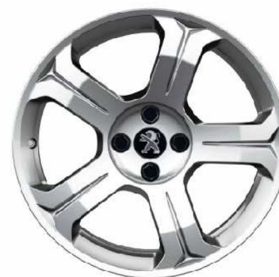
Jante aliaj 18" Licancabur