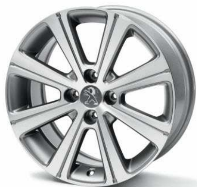
Jante aliaj 17" Melbourne 2